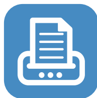
Skapa enkelt dina egna rapporter