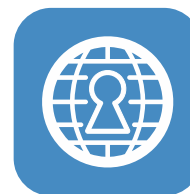
Säker lagring av information