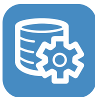
Säkerställd drift 24/7 backup varje natt.